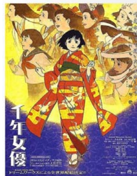
De Satoshi Kon 2001 — 87 minutes