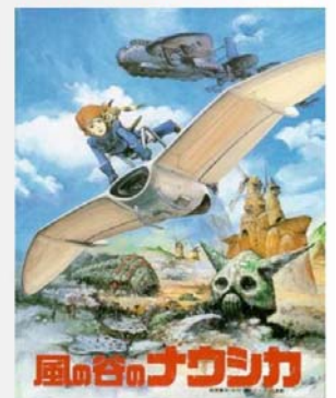
De Hayao Miyazaki 1984 — 116 minutes